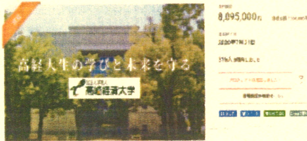
学生の未来を守る。高崎経済大学コロナ禍学生緊急支援特別基金

クラウドファンディングでは寄付を募り 目標金額を700万円 といたしました。その結果 クラウドファンディングでは卒業生のほかその他有志 計316名からご寄付をいただき 目標金額を上回る 8,095,000円 を達成。