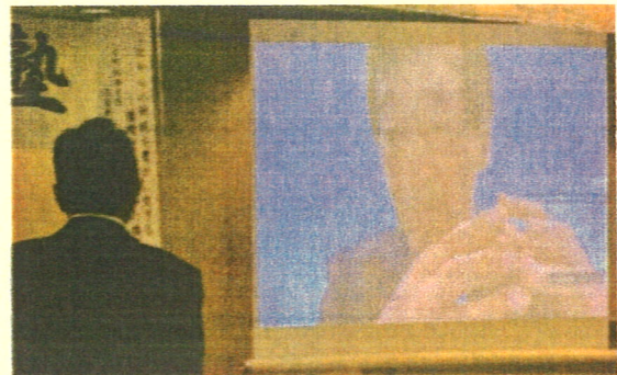
(リモート講演の大宮名誉教授)