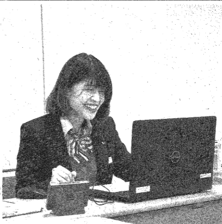
学生からの質問に答える 企業担当者

参加者は前橋市の上 毛新聞社や各企業、自 宅などからそれぞれア クセスした。県内に本 社や拠点のある4社の 採用担当者や同大OG らが事業内容などを紹 介し、仕事のやりがい