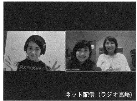
ネット配信（ラジオ高崎）