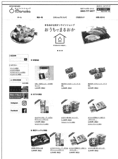
オンラインショップ（スーパーまるおか）

新型コロナウイルス感染拡大防止と「新しい生活様式」への対応として、人と人が直接的に接触しないインターネットの活用が盛んとなっている。